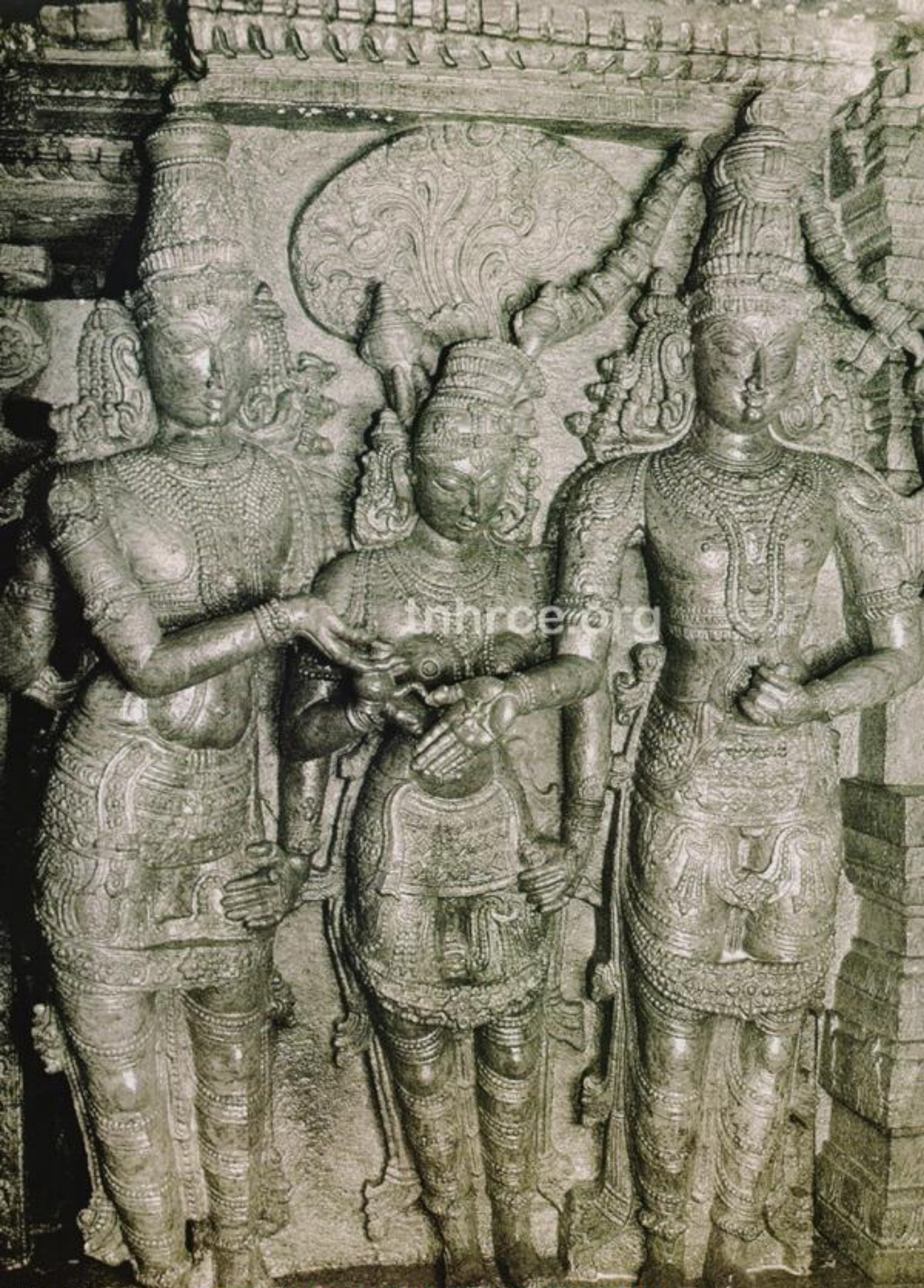
அருளநித மன்னாசி சுந்தரேசுவர திருக்கல்யாணக்கோலம் (கம்பத்தடி மணியடி)