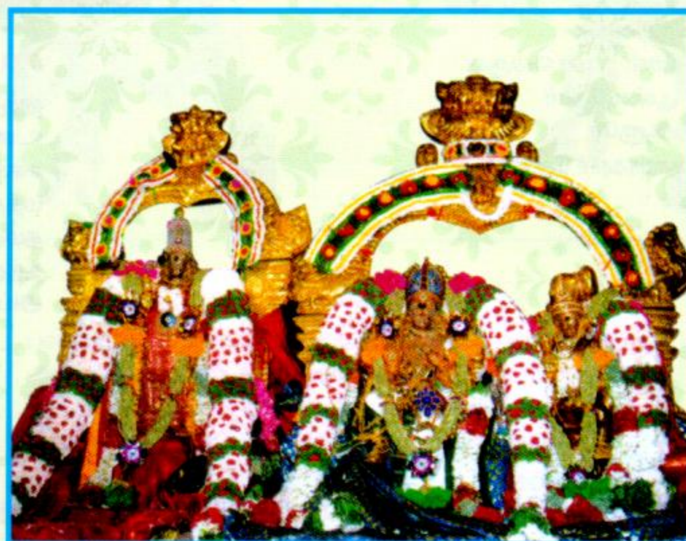
திருக்கல்யாணம் (காலை 8.35மணிக்குமேல் 8.59 மணிக்குள்)

அத்தலை நின்ற மாயோன் ஆதிசெங் கரத்து நங்கை கைத்தலம் கமலப் போது புத்ததோர் காந்தள் ஒப்ப வைத்துஅரு மனுவாய் ஓதக் கரகநீர் மாரி பெய்தான் தொத்தஅலர் கண்ணி விண்ணோர் தொழுதுபு மாரி பெய்தார்