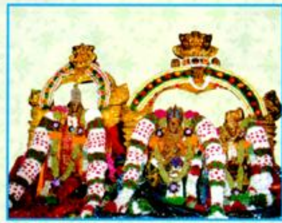
திருக்கல்யாணம் (காலை 8.35மணிக்குமேல் 8.59 மணிக்குள்)

மன்னுலகில் பிறந்து நும்மம் வாழ்த்தும் வழியடியார் பொன்னுலகம் பெறுதல் தொண்டனேன் இன்று கண்டொழிந்தேன் விண்ணுலகத்தவர்கள் விரும்ப வெள்ளையானையின் மேல் ஊனுடல் காட்டுவித்தான் நொடித்தான் மலை உத்தமனே. - சுபத்தி தேவரம்